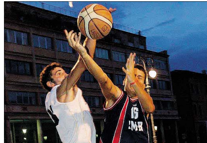
GNAKER, CHE PASSIONE! Uno scontro fra due atleti. Sotto i Senior Pm Interni

da una brillante salvezza. Per il 33 anno dunque, per tutto il mese di luglio il Gnaker, con le sue molteplici sfaccettature (torneo Under 17, Under 14, Minibasket e la Serata delle stelle) allieterà le notti reggiane presso il "Parco del Noce Nero" alla Rosta Nuova. Da quest'anno il torneo avrà anche un partner speciale al quale devolvere la propria azione benefica, si tratta di Ascmad Prora Onlus, che opera presso l'Arcispedale Santa Maria Nuova di Reggio Emilia. (L.c.)